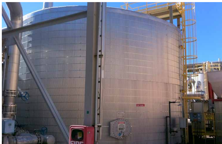
贝尔佐纳 (Belzona) 4331 可用作内衬,为储罐提供保护