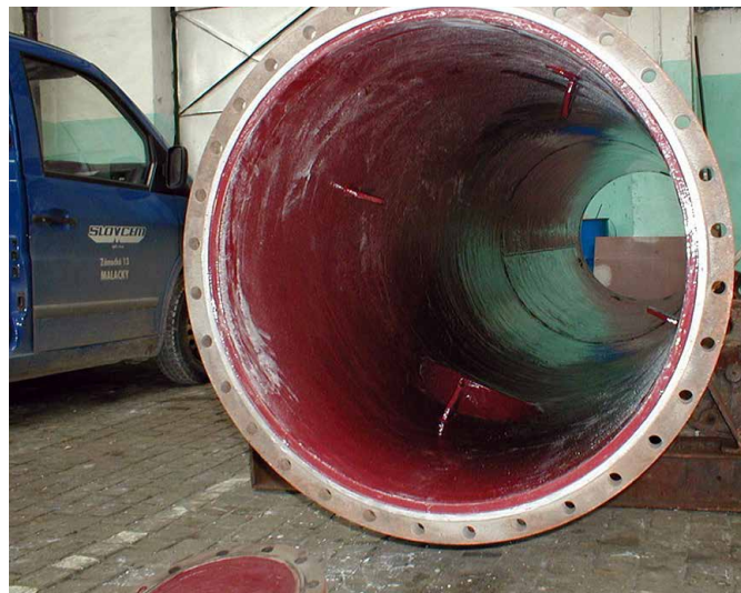
为化学反应塔再施工一层保护层