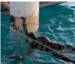
在飞溅区提供持久的腐蚀防护

贝尔佐纳(Belzona) 5831LT 更适合在低温环境下施工，例如，温度更低的近海海域。