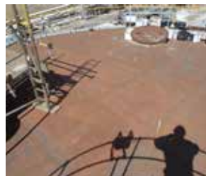
延长设备的使用寿命，耐环境侵蚀