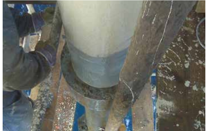
贝尔佐纳(Belzona) 5831LT表面兼容性强，适用于海上应用

与贝尔佐纳 (Belzona) 1161 (一种表面兼容，膏体级的修复复合材料) 结合使用可用作完善的修复解决方案。