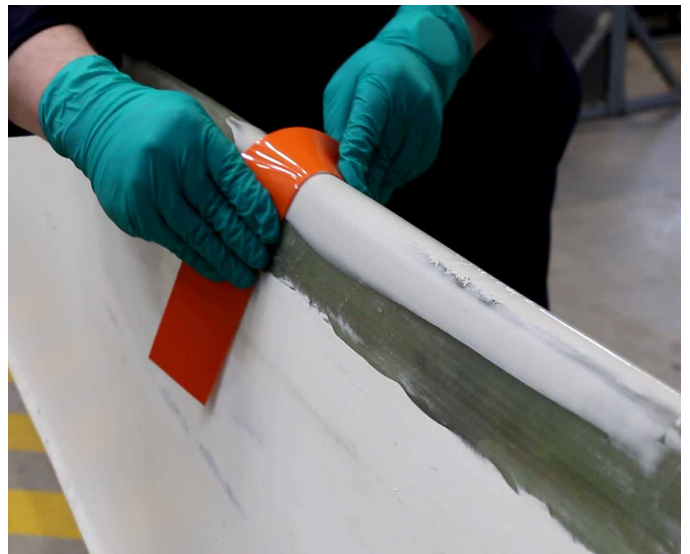
易于与前缘贴合，无需打磨。