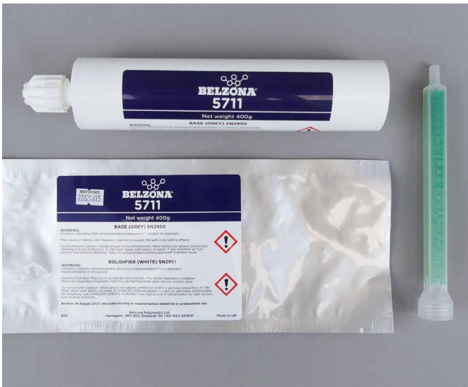
贝尔佐纳 (Belzona) 5711 采用料管包装，配有静态混合器。