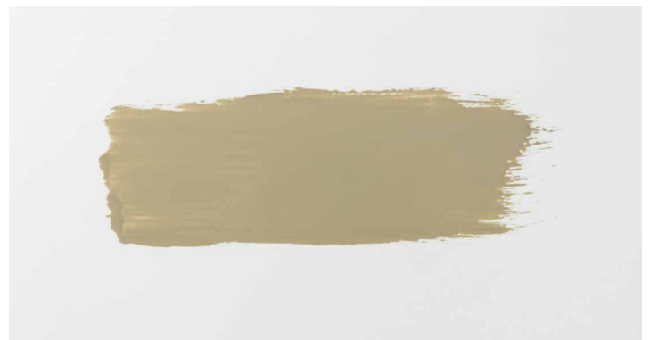
贝尔佐纳 (Belzona) 5815