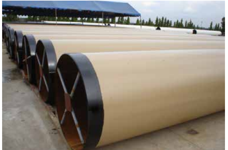
使用贝尔佐纳 (Belzona) 5811 保护地下管道

贝尔佐纳 (Belzona) 5811DW2 获得 WRAS 认证, 可接触饮用水。